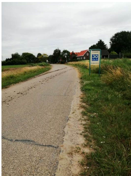
De doorgaande weg van de buurtschap Graszode