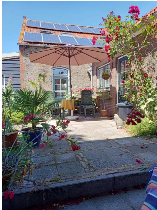
Ons gezellige vakantiehuisje